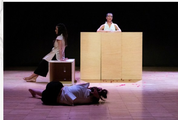
Teaser de Chakai: https://youtu.be/xAXUar4CHU8 Gravació i muntatge de Marc Costa